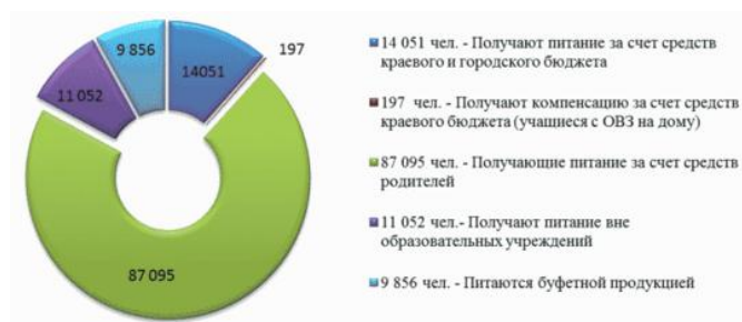
Рис. 2. Структура обучающихся, получающих питание, по категориям

Согласно источнику финансирования предоставления питания обучающимся в общеобразовательных учреждениях города условно можно разделить на 5 основных категорий, структура которых представлена на рисунке 2.