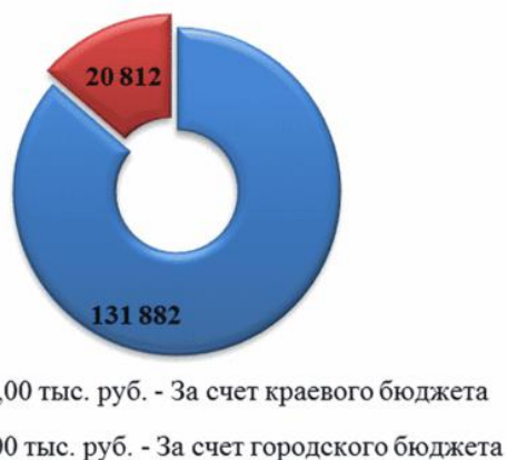
Рис. 3. Структура финансирования организации горячего питания в общеобразовательных учреждениях города за 2018 год

Структура финансирования организации горячего питания в общеобразовательных учреждениях города за 2018 год представлена на рисунке 3.